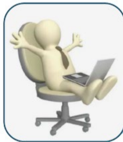
3. Получение выпускником цифрового документа (онлайн + бумажный по желанию)