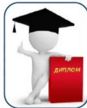
2. Получение бумажного документа об обучении