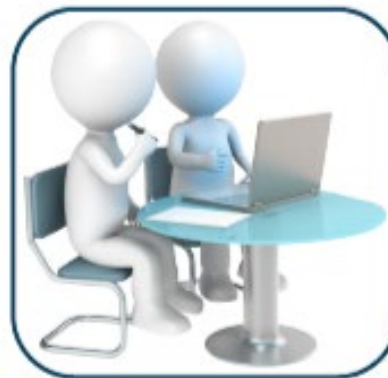
2. Формирование организацией цифрового документа об обучении в ЕР ЦДО